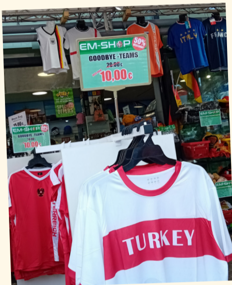
Shirts van goodbye teams gaan snel in prijs omlaag

toch maar weer het centrum. Drie minuten later, jee, we zijn over de middenlijn maar... het staat vast. Dus een bal terug naar de keeper.