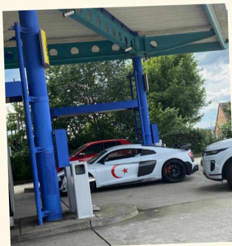
Snelle Turken en route naar Berlijn (dat imponeerde toch wel)

Nederland bleef halve bogen (bananen) spelen: de bal schuiven van een centrumverdediger naar een back, weer terug, dan naar de andere back en, goh,