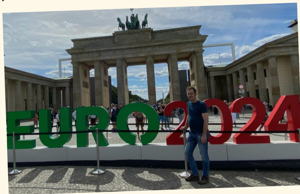
Liam Brady was there, in Berlin. In an Irish pub, of course